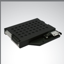
Multimedia Bay 第 2 顆電池