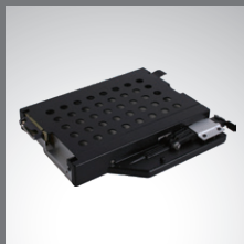
Multimedia Bay 第 2 個儲存裝置